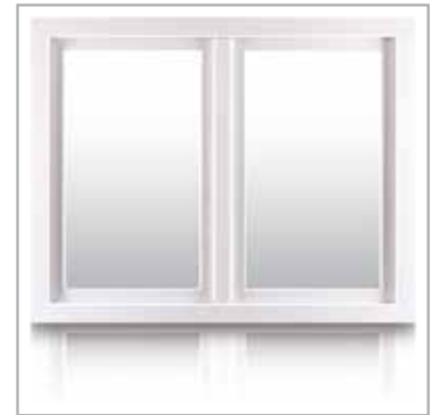
idealne do każdego budynku

Oczekując komfortu, oszczędności energii i nowoczesnego wzornictwa, okna Econo 70 są udanym połączeniem najlepszych parametrów, zachowując atrakcyjną cenę.