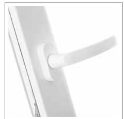
bezpieczna klamka w standardzie