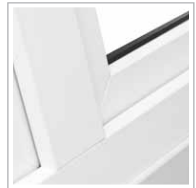
nowoczesna linia skrzydła